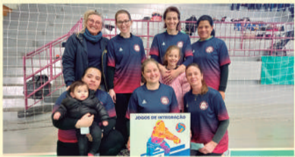
Equipe Santa Helena