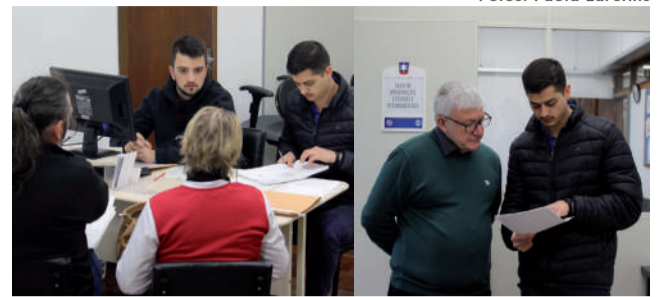
Comunidade pode se beneficiar com o Serviço de Assistência Jurídica Gratuita oferecido pela UCS Bento, localizada no bairro Universitário.

Ele e outros seis docentes rezevam-se na orientação aos alunos, acadêmicos do oitavo semestre em diante, no atendimento aos casos que chegam ao Saju – o serviço integra a grade curricular do Direito da UCS. “Todos são supervisiona-