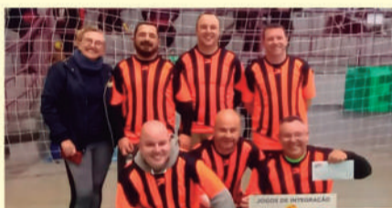
Equipe do Serasa Não Passa