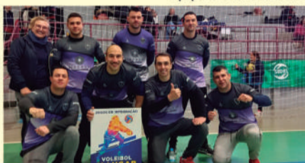
Equipe Guarda Civil Municipal