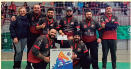
Equipe Real Camilo