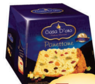
Panettone Casa D'oro 400g.