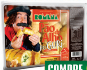
Pão de Alho tradicional Romena 450g.