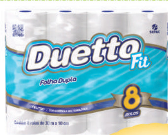
Papel higiênico Duetto Fit 30m c/8un.