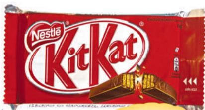
Chocolate Nestlé KitKat 41,5g.