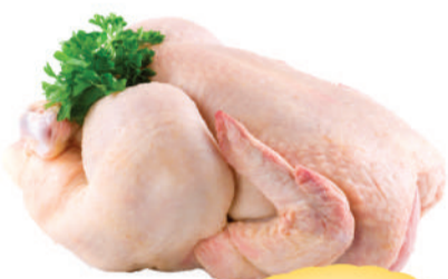
Frango resfriado inteiro kg.