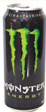
Energético Monster 473ml.