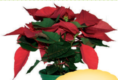
Poissetia vaso P14