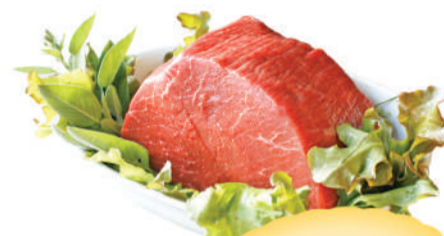
Coxão de dentro bovino pedaço kg.