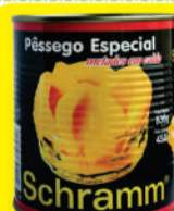
Na compra de 1un. Pêssego Schramm 450g.