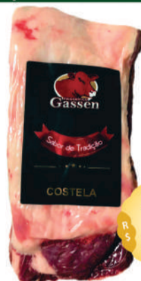
Costela bovina desossada vácuo kg.