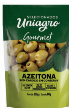
Azeitona verde s/caroço 80g. Uniagro sachet