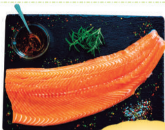
Filé de Salmão inteiro congelado kg.