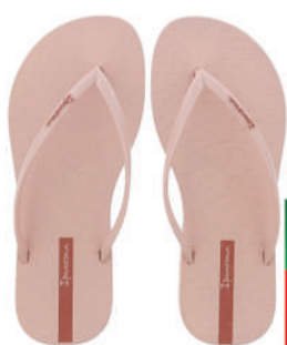
Chinelo Ipanema feminino ou masculino