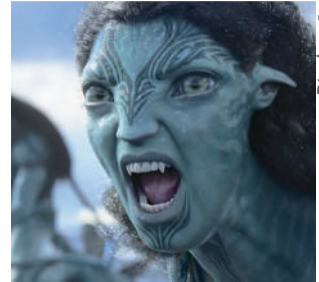
Programação completa em www.serranossa.com.br/cinema

pena. São mais de três horas de um filme que, na sua superfície, mostra a luta pela sobrevivência de uma família, mas que nas suas camadas explora questões ambientais, como a preservação da fauna e flora e dos povos originários - não muito distante da realidade do planeta Terra.