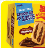
Na compra de 1un. de Panettone 450g. Garoto, Talento, Alpino ou Prestigio