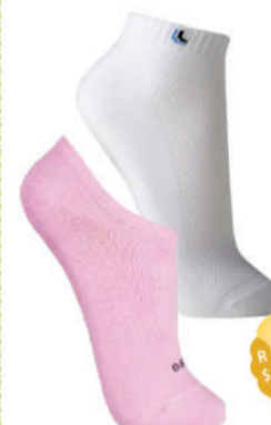
Meia Lupo Walk masculina ou sapatilha feminina