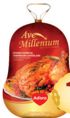
Ave Millennium Adoro kg. Congelada