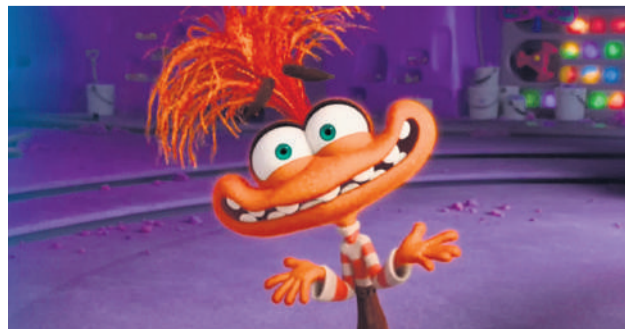
"Divertida Mente 2" é a principal estreia da semana nos cinemas

Sala 02 Divertida Mente 2 13:40h - 3D Dublado (dom.) 13:40h - 2D Dublado (sexta, sábado, segunda, terça, quarta) 16:00h - 3D Dublado (quinta, segunda) 16:00h - 2D Dublado (sexta, sábado, domingo, terça, quarta) 18:30h - 3D Dublado (sexta) 18:30h - 2D Dublado (quinta, sábado, domingo, segunda, terça, quarta) 21:00h - 3D Dublado (sábado) 21:00h - 2D Dublado (sexta, segunda, terça, quarta) 21:00h - 2D Legendado (quinta, domingo)