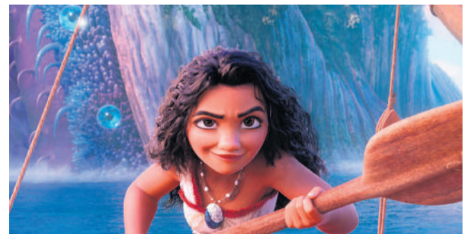
Moana 2 acompanha o reencontro de Moana e Maui para uma nova aventura pelos mares.

Sala 02 Capitão América: Admirável Mundo Novo 13h30 - 2D Dublado (quinta, sexta, sábado, domingo, terça, quarta) 16h - 2D Dublado (quinta, sexta, sábado, terça, quarta) 16h - 3D Dublado (domingo) 18h30 - 2D Dublado (sábado, terça, quarta) 18h30 - 3D Dublado (quinta) 18h30 - 2D Legendado (sexta, domingo, quarta) 21h - 2D Dublado (quinta, sexta, sábado, domingo, quarta) 21h - 2D Legendado (terça)