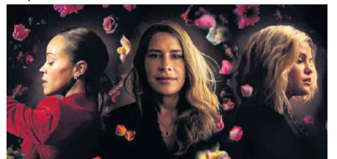
Dirigido e escrito pelo premiado cineasta Jacques Audiard, o filme acompanha Rita (Saldana), uma advogada de um grande escritório que está mais interessada em libertar os criminosos do que em levá-los à justiça.